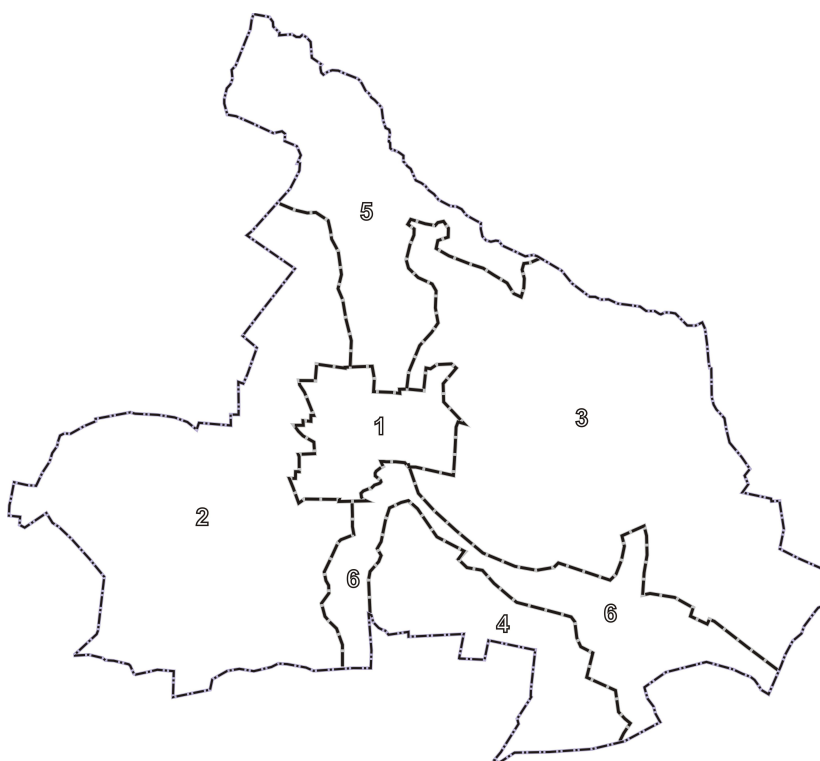
Rysunek. Podział gminy na jednostki polityki przestrzennej.

W jednostce dopuszcza się rozwój innych funkcji, jednak przy założeniu unikania kolizji z funkcjami środowiskowymi. W szczególności wskazuje się na dobre predyspozycje dla działalności rekreacyjno-turystycznych oraz sportów wodnych. Notec i Kanał Notecki stanowią część drogi wodnej o znaczeniu międzyregionalnym – dopuszcza się rozwój zagospodarowania związanego z organizacją transportu wodnego i turystyki wodnej. Dopuszcza się kontynuację gospodarki rolnej – zwłaszcza ekstensywnych użytków zielonych oraz hodowli. Dopuszcza się prowadzenie gospodarki rybackiej. Ograniczać należy realizację nowej zabudowy mieszkaniowej.