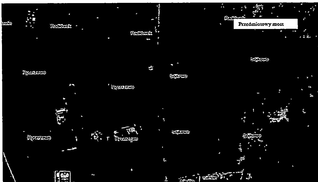
Rys. 1. Lokalizacja mostu

Dz. nr 3 obręb 040704_2.0040 Sójkowo, gmina Inowrocław