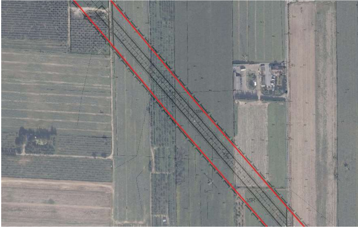
Teren inwestycji liniowej