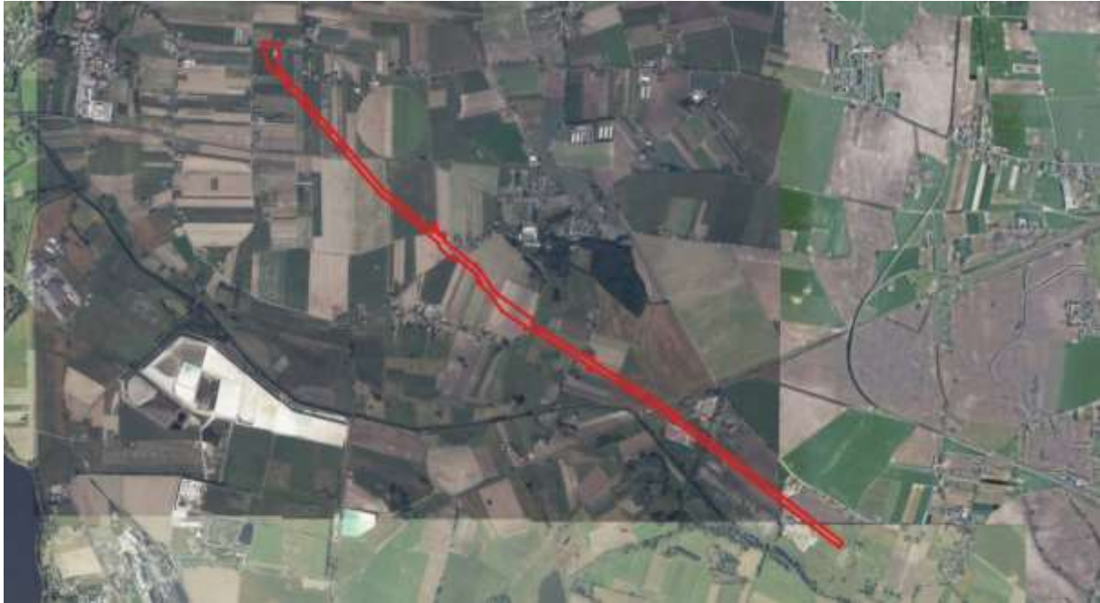
Orientacyjna lokalizacja analizowanego obszaru

Analizowany teren leży w Gminie Pakość w części obrębów Wielowieś, Gorzany, Kościelec i Dziarnowo. Powierzchnia obszaru to około 36 ha, długość około 6,5 km.