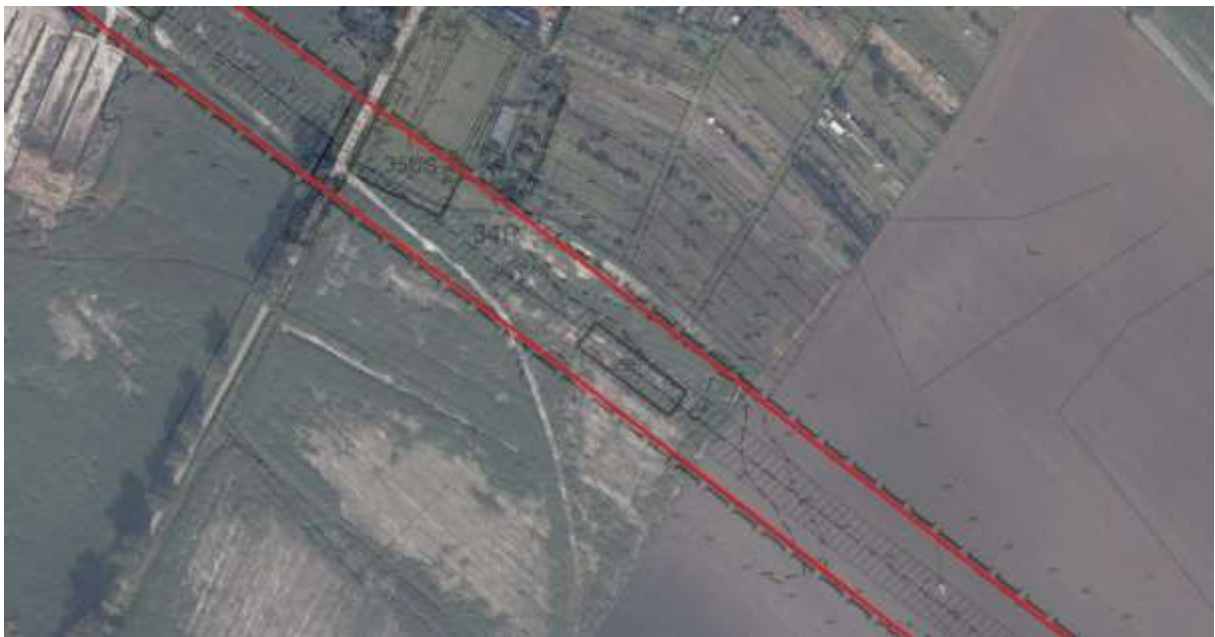
Teren inwestycji liniowej