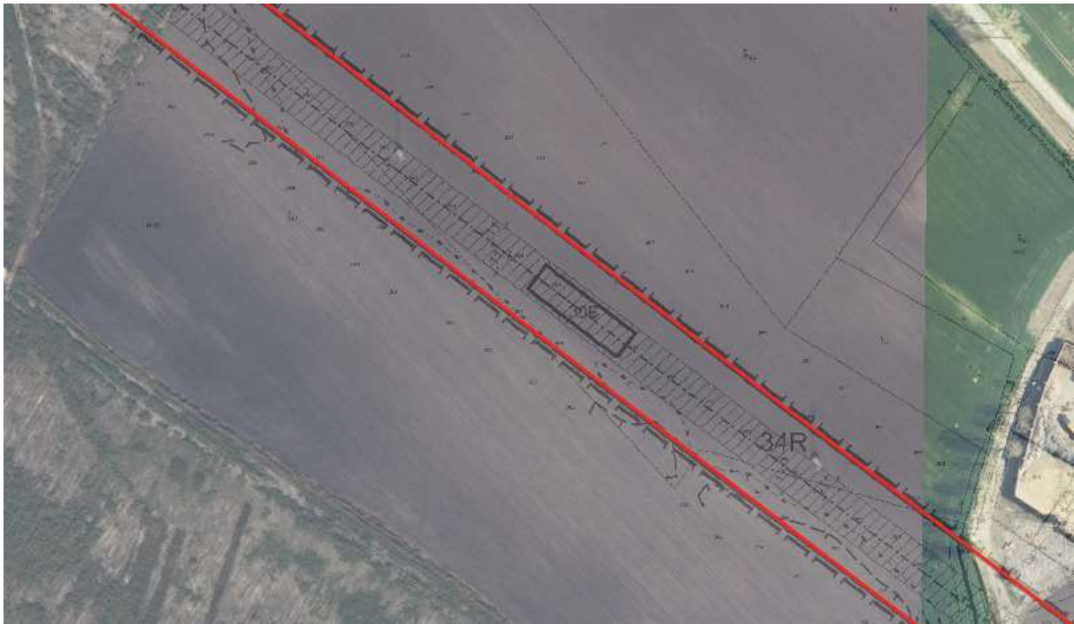
Teren inwestycji liniowej