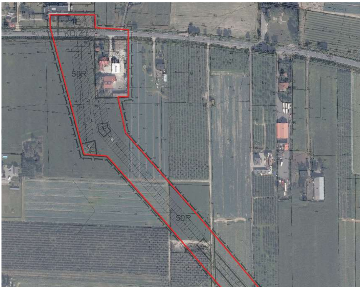
Teren inwestycji liniowej – część północna

W rejonie brak jest lasów. Poniżej przedstawiono najbliższe sąsiedztwo analizowanego obszaru, kierując się od północy na południe.