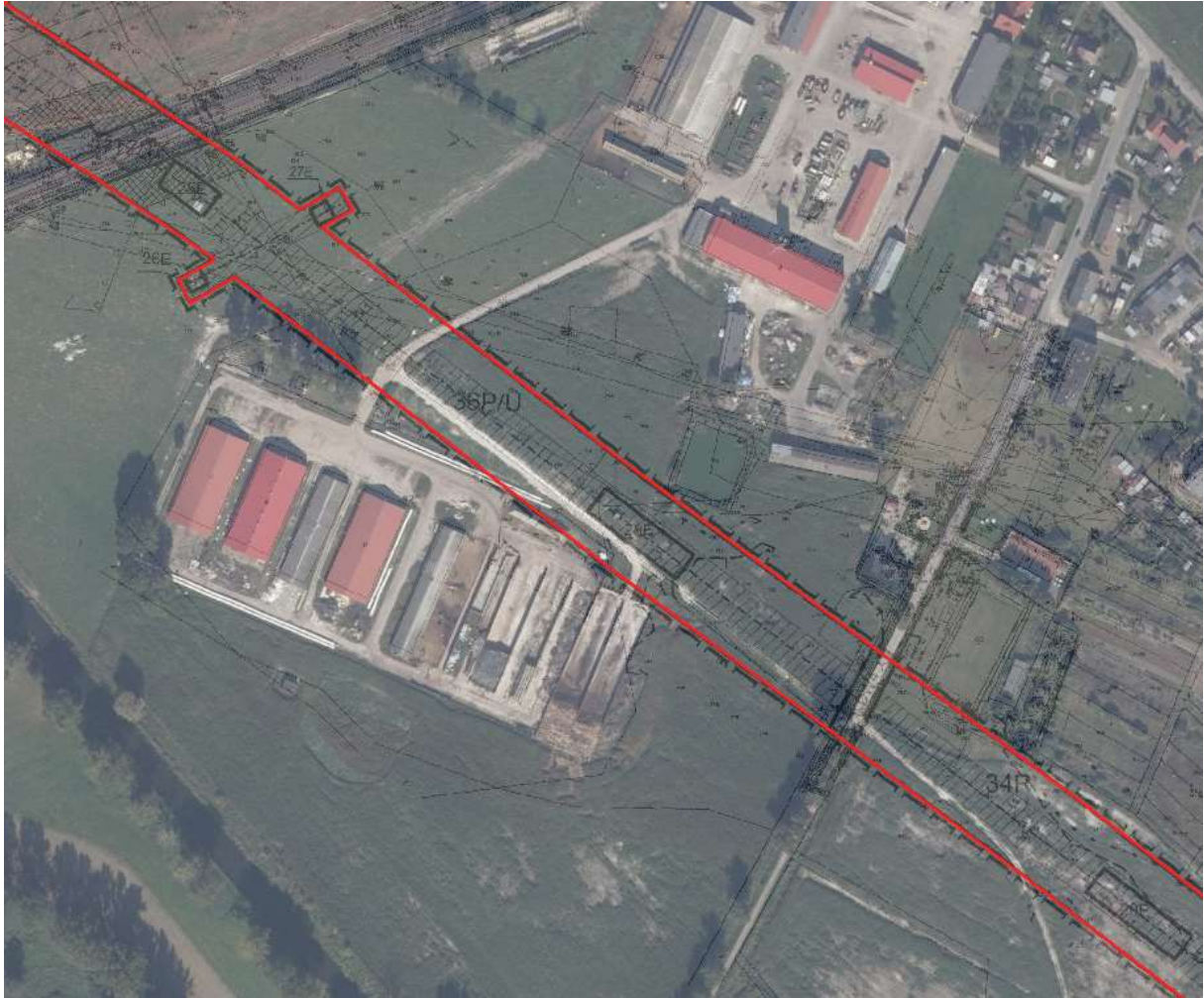
Teren inwestycji liniowej