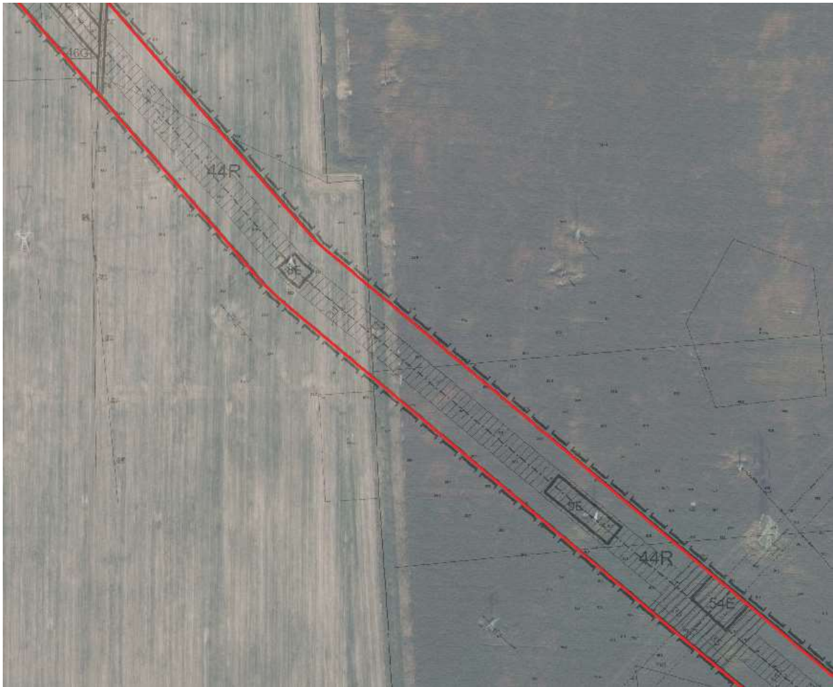
Teren inwestycji liniowej