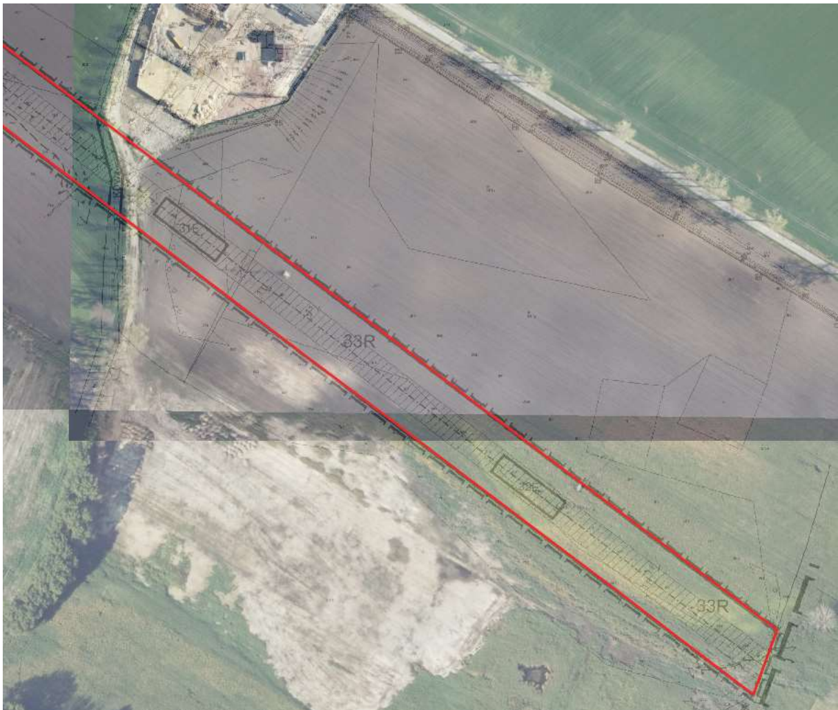
Teren inwestycji liniowej – część południowa