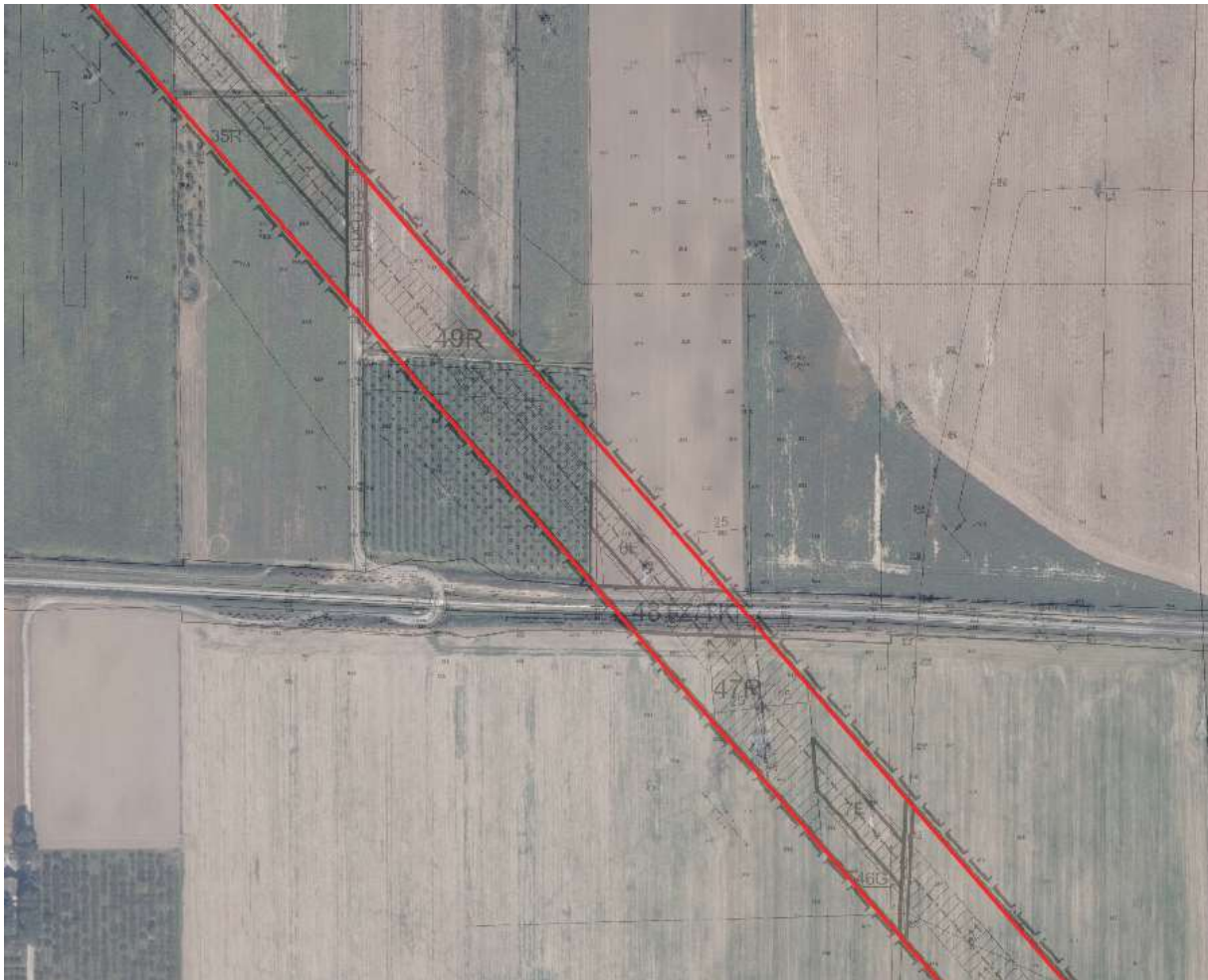
Teren inwestycji liniowej