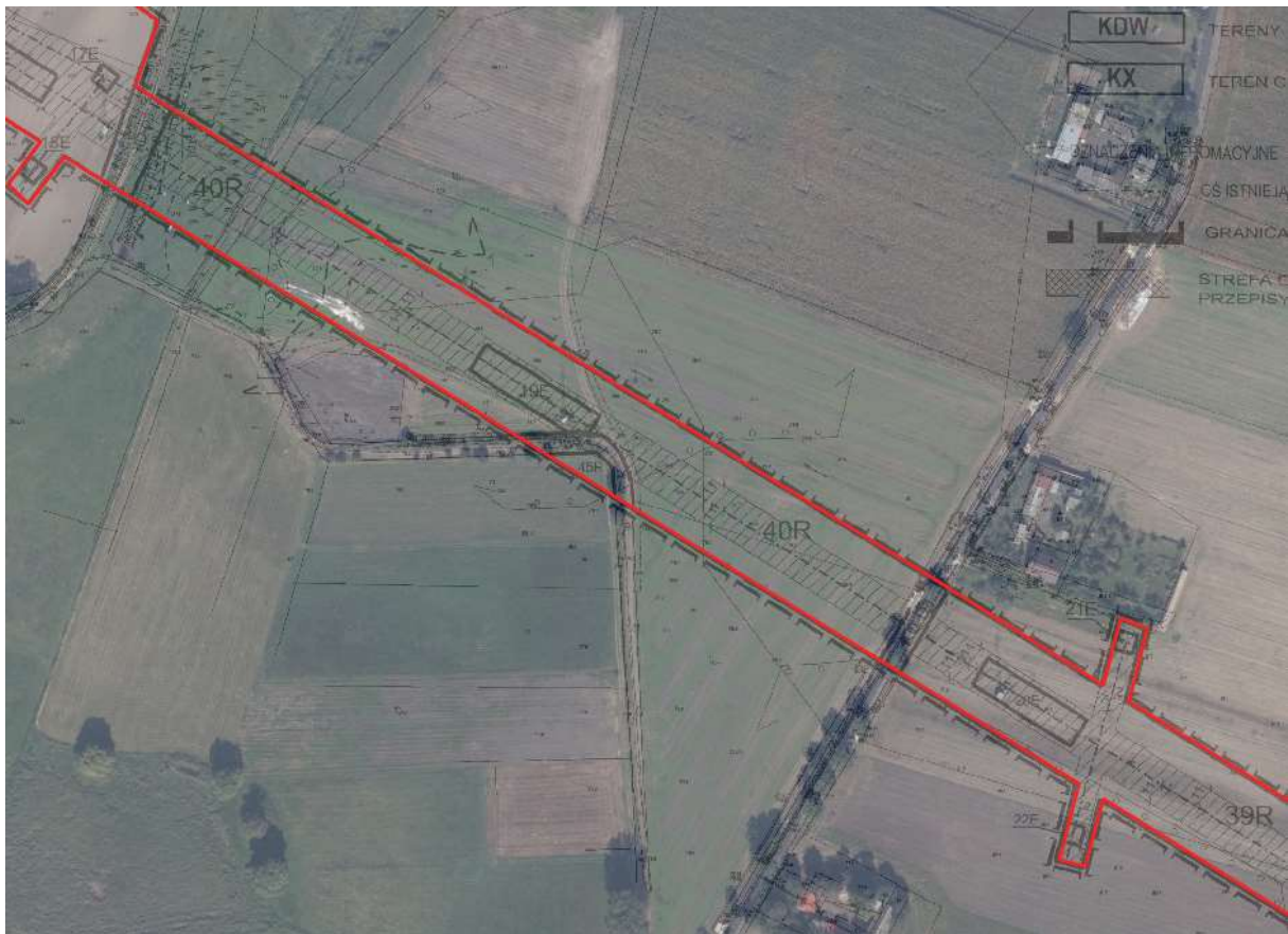
Teren inwestycji liniowej