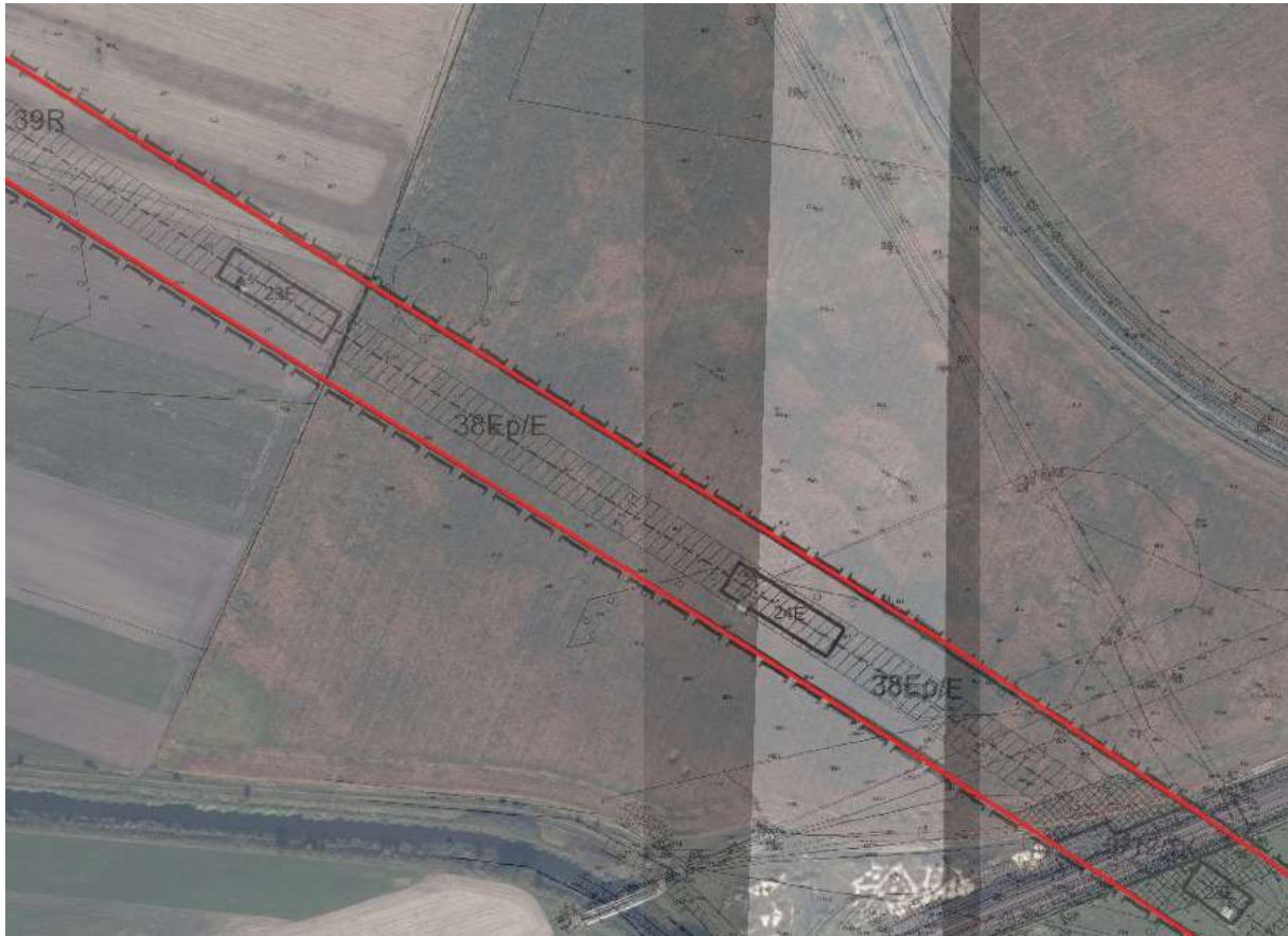
Teren inwestycji liniowej