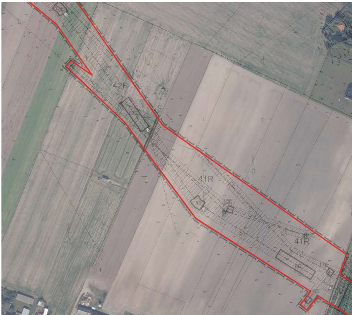
Teren inwestycji liniowej