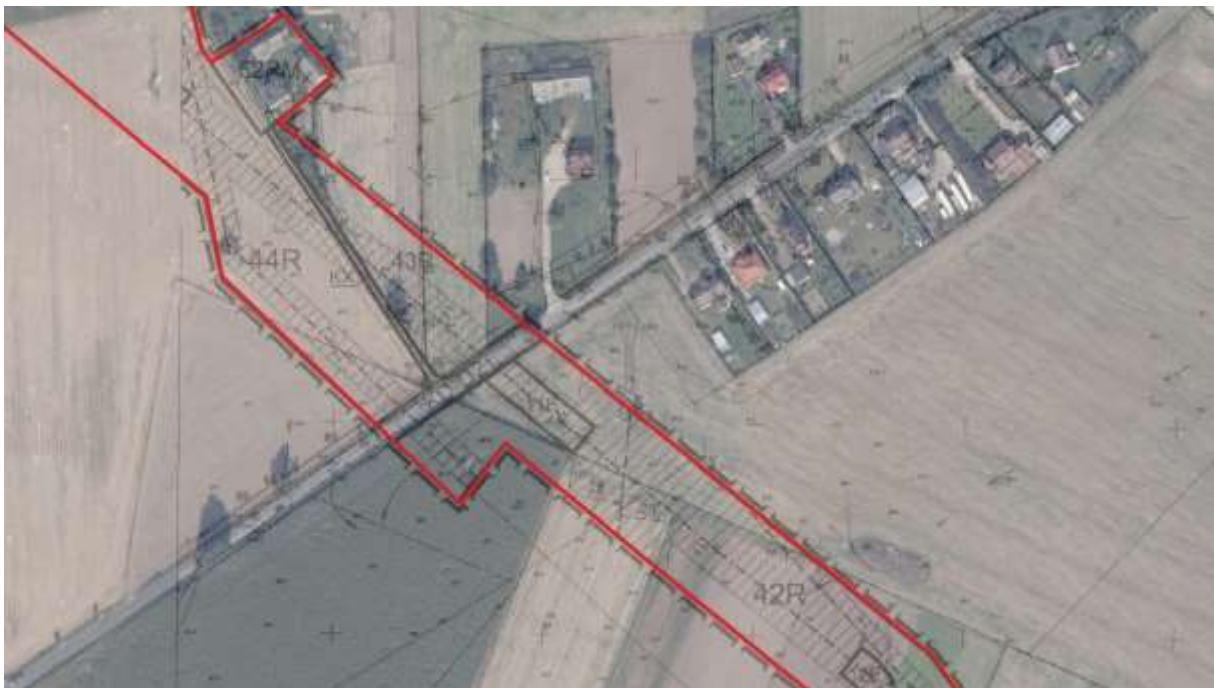
Teren inwestycji liniowej