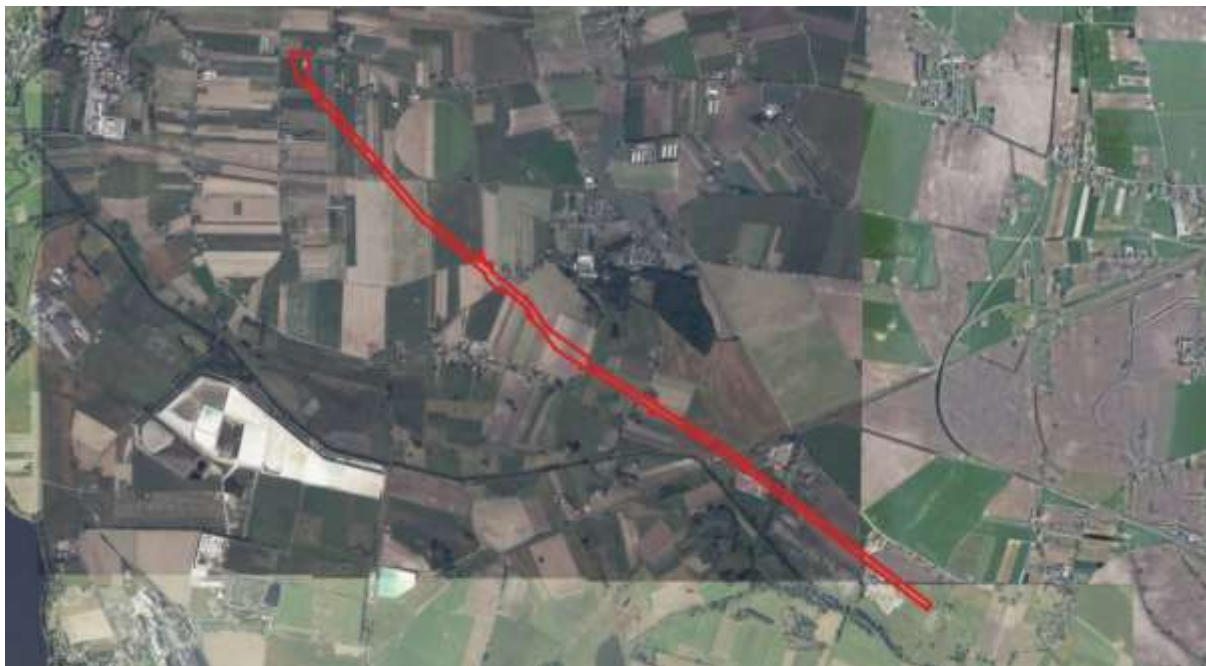
Orientacyjna lokalizacja analizowanego obszaru

Analizowany teren leży w Gminie Pakość w części obrębów Wielowieś, Gorzany, Kościelec i Dziarnowo. Powierzchnia obszaru to około 36 ha, długość około 6,5 km.