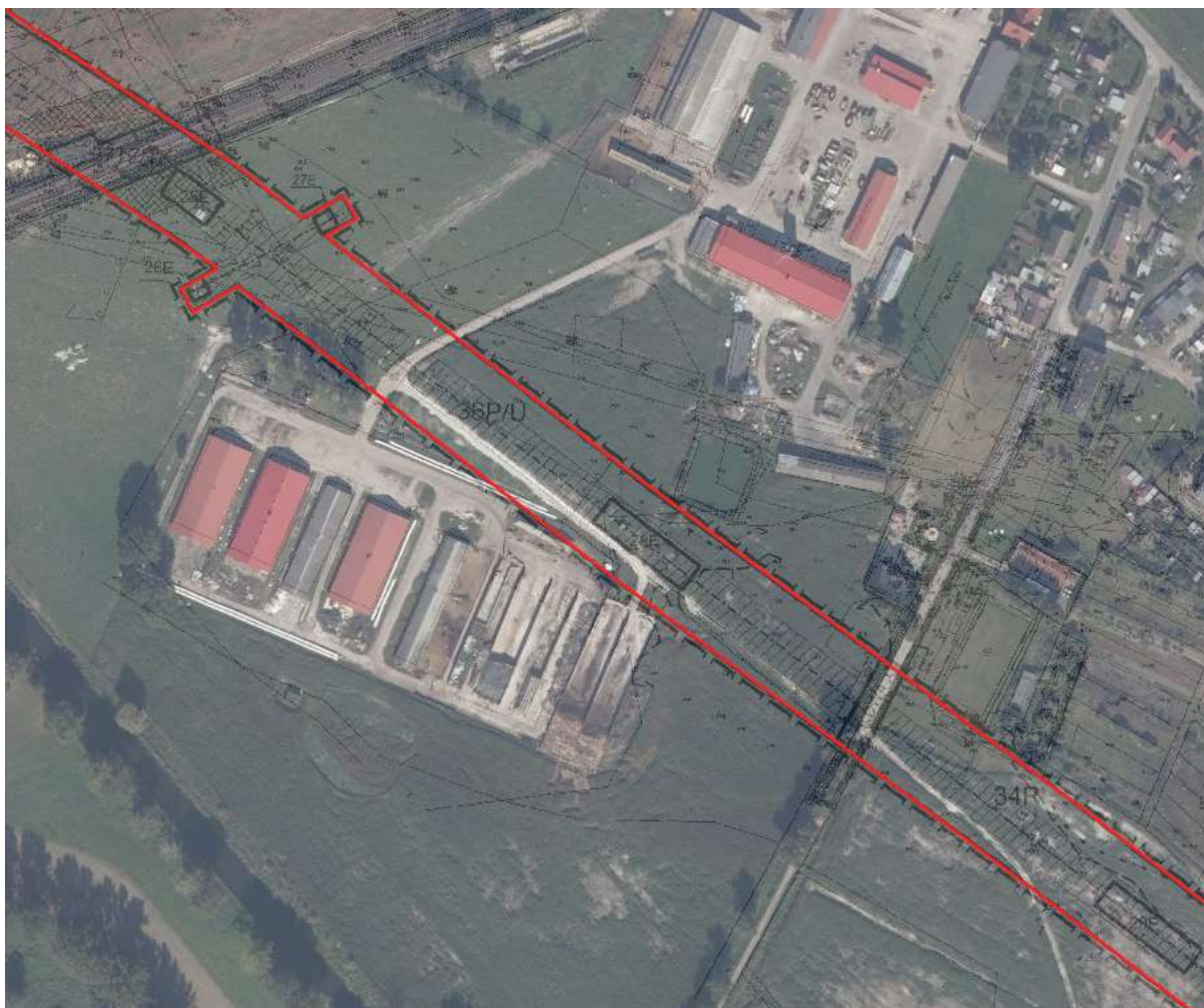
Teren inwestycji liniowej